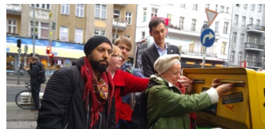
↑ Brauchen Unterstützung: Die Betroffenen des Naziterrors und Bürgermeister Hikel werfen ihren Brief an den Generalbundesanwalt ein. Die Antwort: eine Absage.