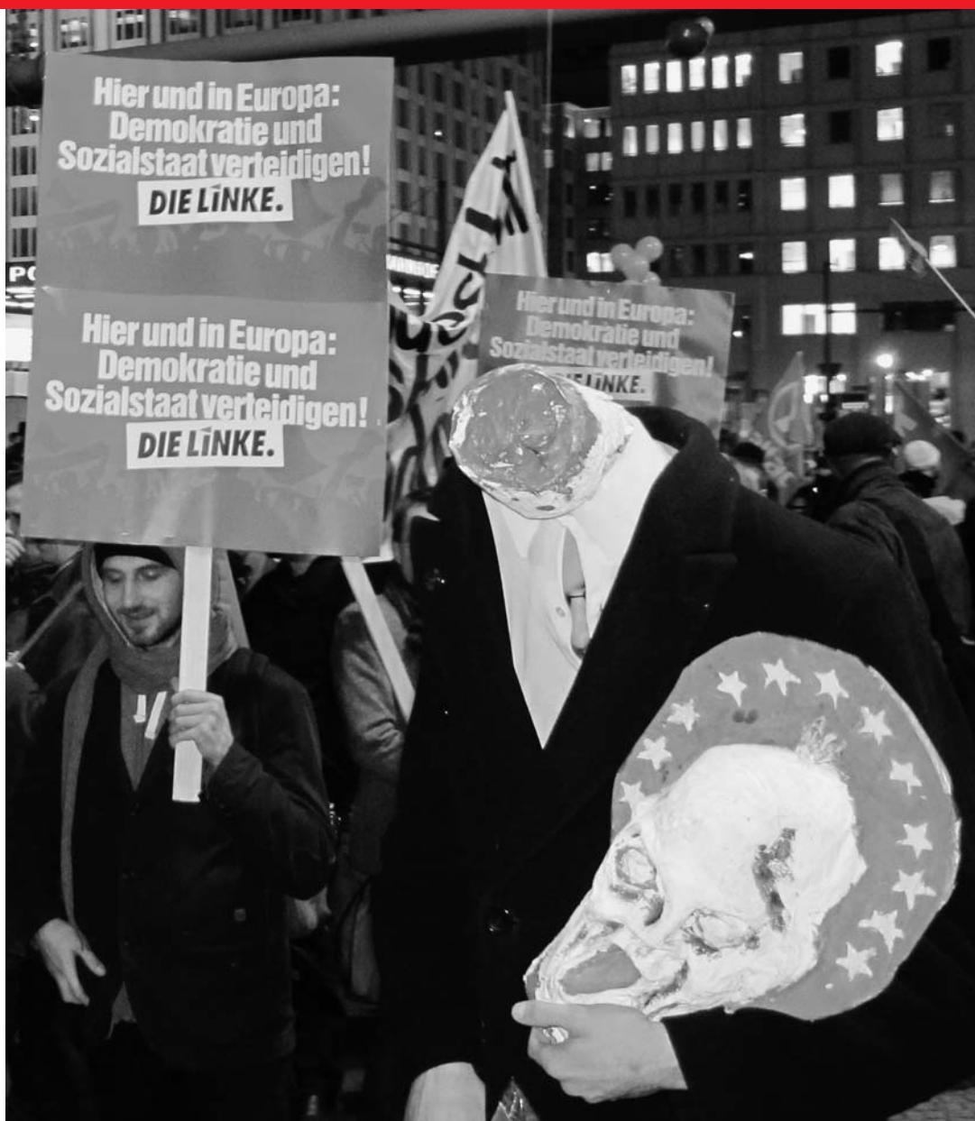
Millionen von Menschen sind am 14. November in Griechenland, Portugal, Spanien, Zypern in den Streik getreten gegen die Spar- und Verarmungspolitik der EU. Unser Foto: Solidaritätsdemonstration in Berlin.

Spendenkonto: Friedens- und Zukunftswerkstatt e.V., Verwendungszweck: Griechenland. Frankfurter Sparkasse, BLZ: 50050201, Kontonummer: 200081390. Sie können eine Zuwendungsbescheinigung für das Finanzamt erhalten, wenn Sie Ihre Adresse mitteilen: per Mail an frieden-und-zukunft@t-online.de .