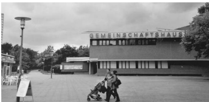
Treffpunkt am Bat-Yam-Platz: Das Gemeinschaftshaus Gropiusstadt.