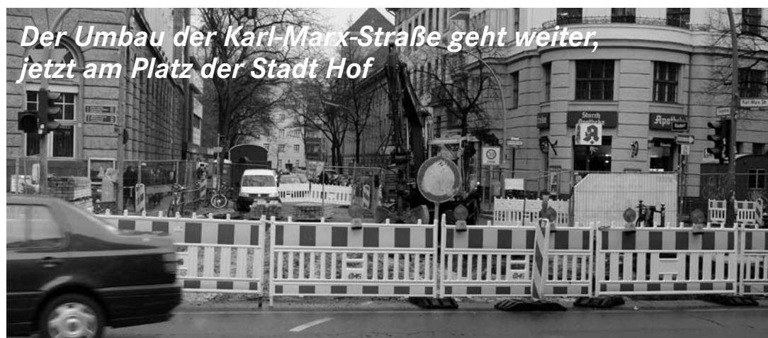
Mit der Sperre der Ganghoferstraße ist die Autofahrt von der Karl-Marx-Straße nach Rixdorf weitgehend dicht. Bereits in den ersten Tagen verlagerte sich der Autoverkehr in Rixdorf von der Richardstraße zur Donaustraße.

ten. Bei der Hörberatungsstelle handelt es sich um eine seit 1959 präventiv tätige Gesundheitseinrichtung, die versucht, die Folgen von Hörschäden zu verringern. Denn schlecht oder überhaupt nichts hörende Kinder haben größte Schwierigkeiten beim Erlernen der Sprache. In der Neuköllner Einrichtung stehen mit dem speziell für die Diagnostik von Hörbehinderung von Kindern errichteten Gebäude hervorragende Bedingungen zu Verfügung. Auch bietet diese unabhängige Beratung eine Alternative zu den HNO-Abteilungen der Krankenhäuser, wo stärker operative Behandlungen angestrebt werden. Hinzu kommt, dass die Neuköllner Hörberatungsstelle sehr gut mit Kinderbetreuungseinrichtungen und Schulen vernetzt ist. RO