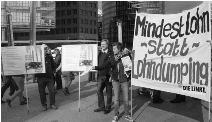
Zum „UmFAIRteilen“ gehört Mindestlohn statt Lohndumping.

Über 40.000 Menschen beteiligten sich am 29. September am bundesweiten Aktionstag "UmFAIRteilen - Reichtum besteuern", unter ihnen zahlreiche Mitglieder und Sympathisantinnen und Sympathisanten der LINKEN. Sie forderten lautstark und unübersehbar, die gigantischen privaten Vermögen, die sich in den Händen einiger weniger Superreicher befinden, durch eine Millionärsteuer und eine einmalige Vermögensabgabe zur Finanzierung öffentlicher Aufgaben heranzuziehen. Wer an der Demonstration nicht teilnehmen konnte, kann sich im Internet ein Bild machen: www.dielinke.de/dielinke/mediathek/bilder/2012/umfairteilen-reichtumbesteuern .