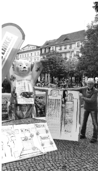
Wenige Tage vor dem Aktionstag: „UmFAIRteilen“-Aktion in Neukölln.