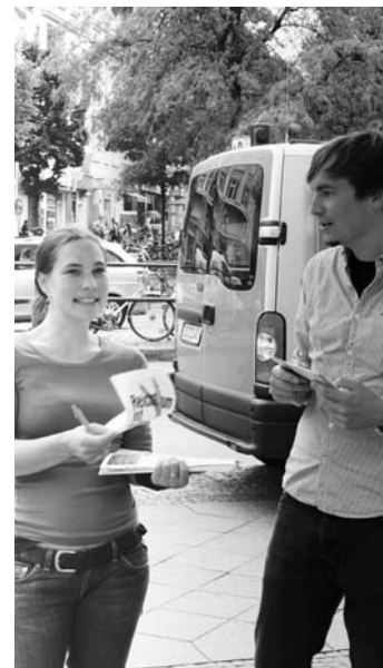
„Reichtum teilen!“ Passanten nahmen sich Zeit für Diskussionen.