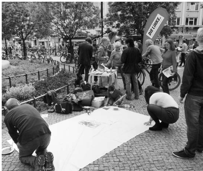
Beim Informationsstand der Neuköllner LINKEN vor dem Rathaus wurde ein Transparent für die Demonstration am 29. September gestaltet.