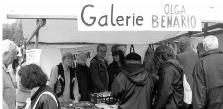
Die Galerie Olga Benario ist bei vielen Aktionen dabei. hier am 1. Mai.

Die Veranstaltungen beginnen jeweils um 19.30 Uhr, Richardstraße 104, 12043 Berlin. Fahrverbindung: U-Bhf. Karl-Marx-Straße (U7). Weitere Informationen: www.Galerie-Olga-Benario.de