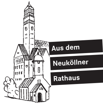
Vignette: Franz Zauleck

ten sich des Eindrucks nicht verwehren, dass die Fraktionen der großen Koalition im Bezirk die Haushaltsberatung nicht ernst genommen haben und nur als verlängerter Arm des Bezirksamts gehandelt haben.