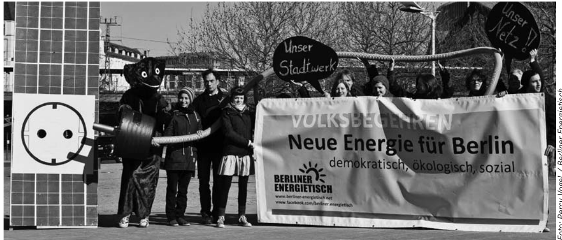
Start zum Volksbegehren „Neue Energie für Berlin“.

Ziel ist, dass das Land Berlin die Energieversorgung wieder selbst in