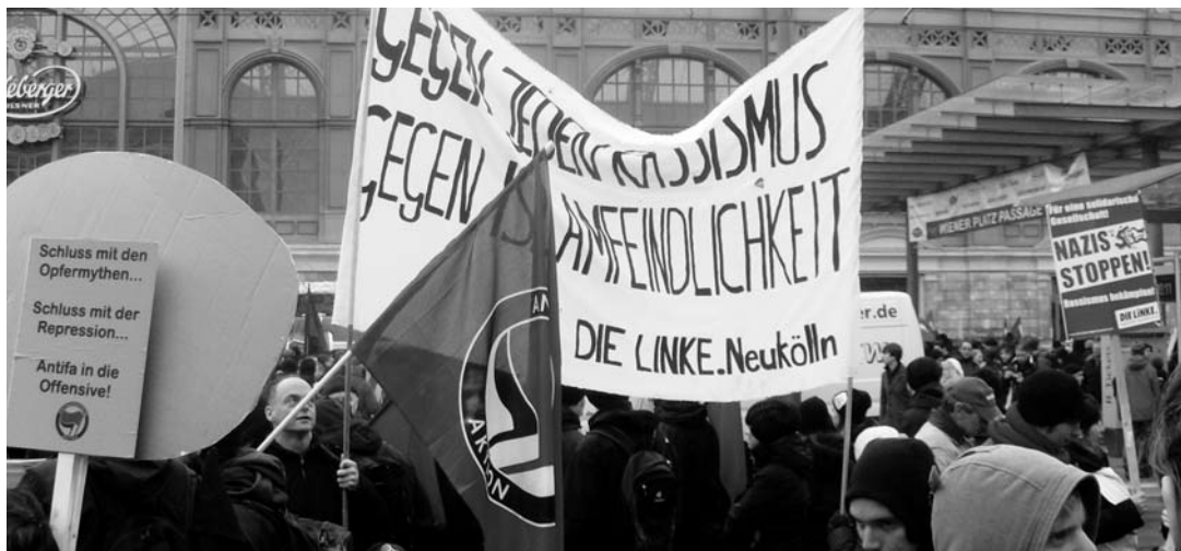
Gegen jeden Rassismus - gegen Islamfeindlichkeit demonstrierten Mitglieder der Neuköllner LINKEN in Dresden.

So versammelten sich am Montag, dem 13. Februar, bis zu 1.200 Nazis in Dresden. Ihnen standen ca. 6.000 entschlossene AntifaschistInnen gegenüber, mehr als 10.000 hatten sich den Tag über an der Menschenkette gegen Nazis beteiligt. Weit kamen die Nazis dank der Blockaden des Bündnis Dresden Nazifrei! nicht. Ihr „Aufmarsch“ wurde so abermals zu einer Lachnummer. Nicht nur, dass sie nur wenige Meter laufen konnten, ihr Mobilisierungspotenzial zu Europas einst größtem Nazi-Event ist mit diesem Jahr eindeutig mehr als hinüber.