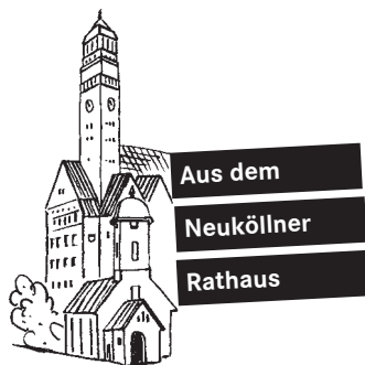
Vignette: Franz Zauleck

Für in der Sache unwesentliche Erweiterungen waren die Piraten bereit, sich von ihrer dem Wachschutz eher skeptischen Position zu verabschieden und als Antragsteller für Wachschützer an Schulen aufzutreten. Im Vorfeld der Bezirksverordnetenversammlung hatten die Piraten noch mit den Fraktionen der