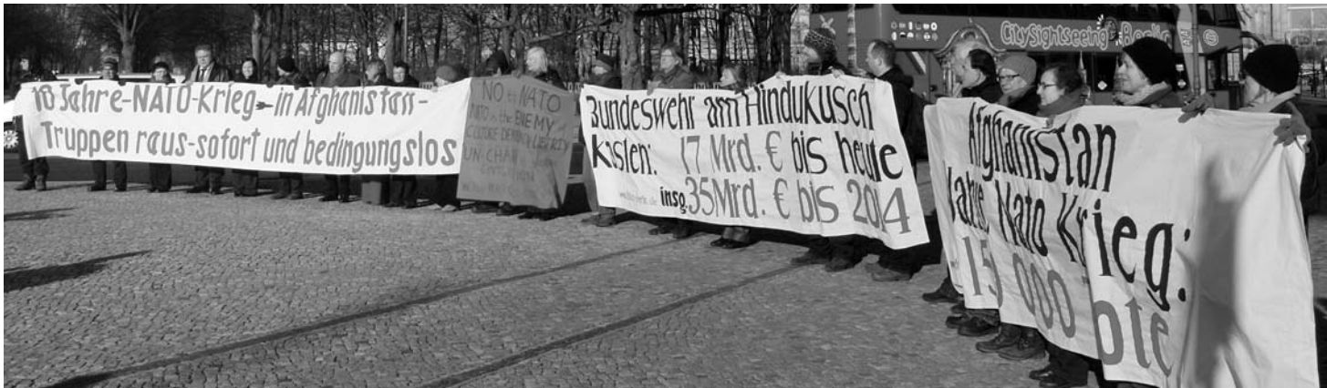
Mit einer Mahnwache am Brandenburger Tor, in Sichtweite des Reichstagsgebäude, protestierten Aktive der Friedensbewegung gegen die Verlängerung des Mandates für den Bundeswehreinsatz in