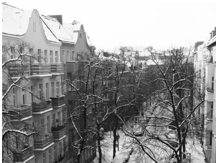
Kein Winter ist gleich. Die Heizkosten sind es deshalb auch nicht.

Der BGH erklärte jetzt die Abrechnung nach dem Abflussprinzip für unzulässig. Die entsprechenden Klauseln in Mietverträgen sind damit unwirksam. Vermieter können also auch nicht mehr ihre Rechnung für die Öllieferung vorlegen und sie den Mietern ohne Angabe des tatsächlichen Jahresverbrauchs anteilig in Rechnung stellen.