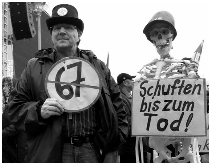
Von Anfang an: Protestaktion 2007 von LINKEN und Gewerkschaften gegen „Rente erst ab 67“.

Ausführliche Beiträge „Auch 2012 - Nazis stoppen“ lesen Sie auf Seite 3