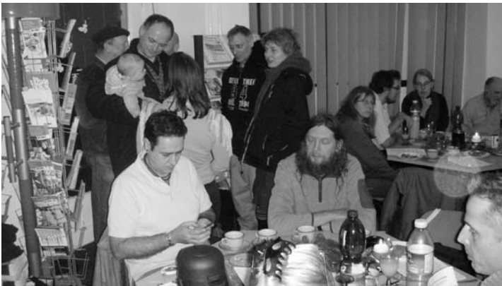
Jahresabschluss 2011 bei den Neuköllner LINKEN. Zum Ausklang des ereignisreichen Jahres, nach erfolgreichem Volksbegehren zur Rettung der S-Bahn, Berliner Wahlkampf und Debatte zum Parteiprogramm setzten sich