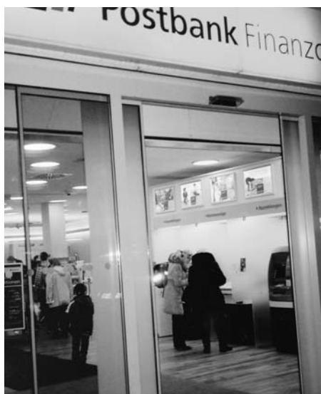
Die große Ausnahme: Ersatzbau für das zugunsten eines Supermarkts abgerissene Postamt Britz-Süd.

Ersatzbau für ein - zugunsten eines Supermarktes samt Parkhaus - abgerissenes Postamt in Britz-Süd.