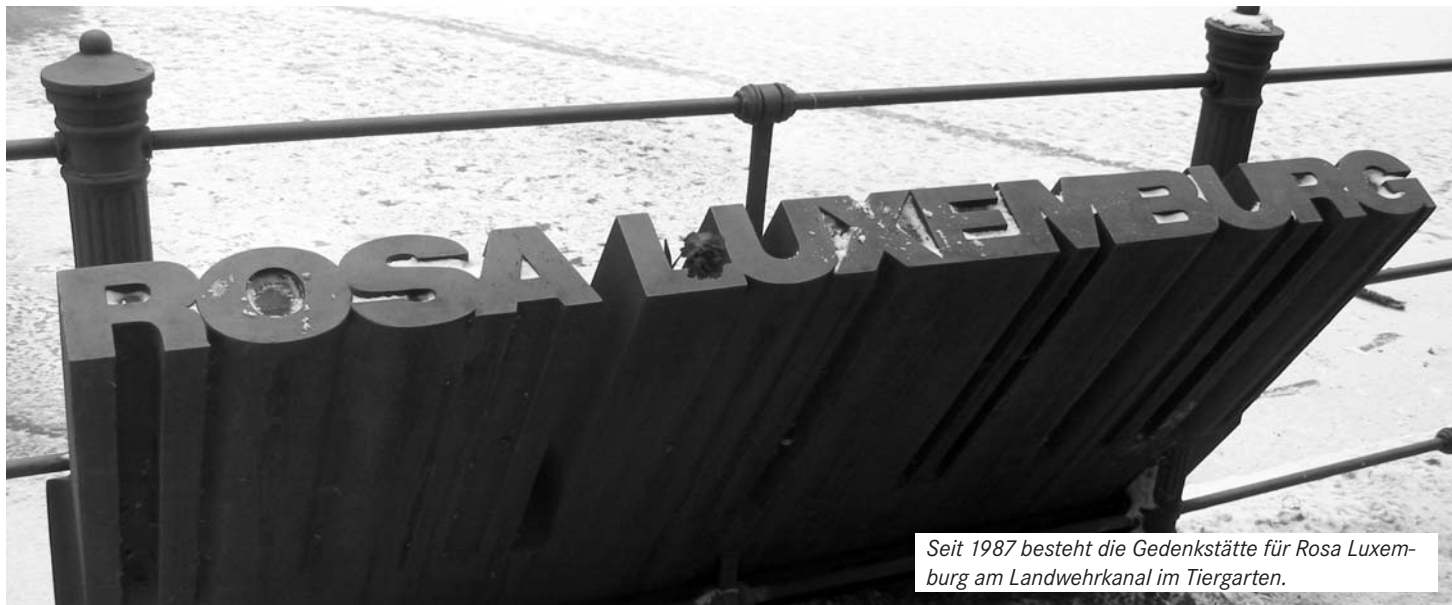
Seit 1987 besteht die Gedenkstätte für Rosa Luxemburg am Landwehrkanal im Tiergarten.