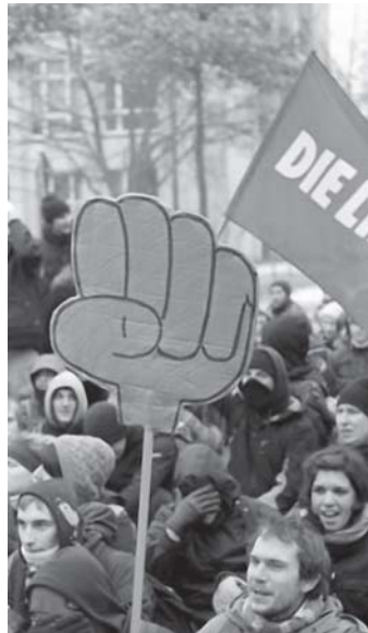
20.000 Menschen blockierten im vergangenen Jahr erfolgreich den Nazi-Aufmarsch in Dresden.

Was bedeutet das für Neukölln? Lesen Sie den Bericht auf Seite 8