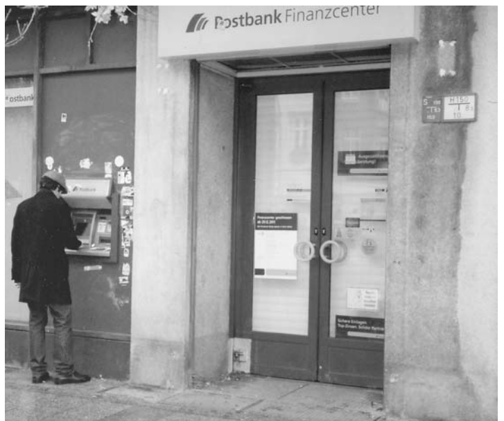
Lang ist die Liste der geschlossenen Postämter in Neukölln. Seit Ende 2011 gibt es an der Hermannstraße/Werbellinstraße keine Post mehr.

man es von einem Standort zum anderen vagabundieren. Eine verhandlungsbedingte Ausnahme bildet der