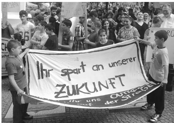
Kinder und Jugendliche demonstrieren, dass sie sich für die eigene Zukunft einsetzen. Das sind ihre Stärken, die zu fördern sind.