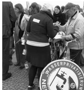
Volksbegehren Wasser in Berlin.

„Sie haben den Wasserpreis angehoben, die Qualität des Wassers verschlechtert, die Wartung und Erneuerung des Netzes reduziert“, zieht der ehemalige stellvertretende Bürgermeister von Grenoble, Raymond Avrillier, Bilanz aus der Wasserprivatisierung in Frankreich. Der Film „Water Makes Money“ zeigt, wie die französischen Wassermultis VEOLIA und SUEZ ihren globalen Erfolgskurs finanzieren.