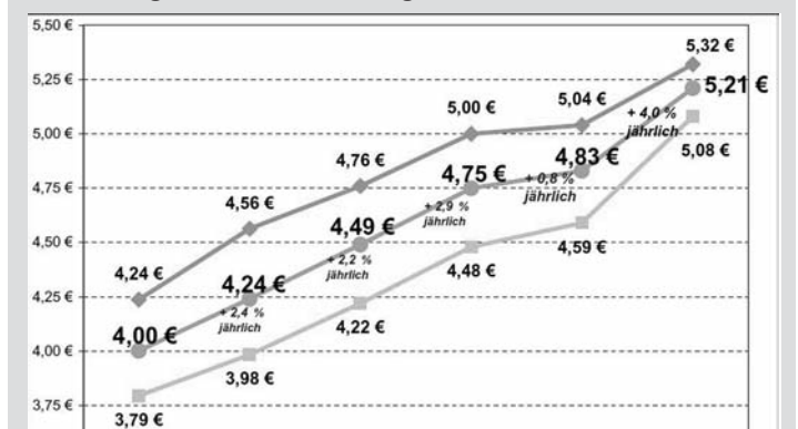
Entwicklung der ortsüblichen Vergleichsmieten 2000 bis 2011

Obere Kurve: Durchschnittliche Entwicklung (Neubau), mittlere Kurve: Durchschnittliche Entwicklung (alle), untere Kurve: Durchschnittliche Entwicklung (Altbau).: Institute GEWOS, A&K und F+B aus Mietspiegel 2000 bis 2011, Berechnungen der Senatsverwaltung für Stadtentwicklung Berlin