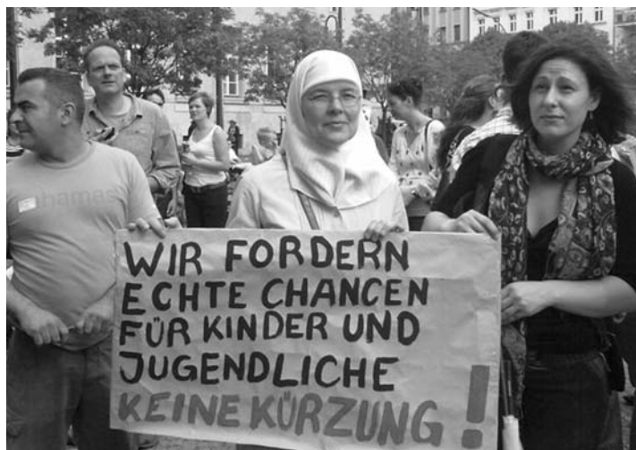
Die geplanten Kürzungen im Neuköllner Bezirksetat sind eine Kampfansage an alle Jugendeinrichtungen in Neukölln.