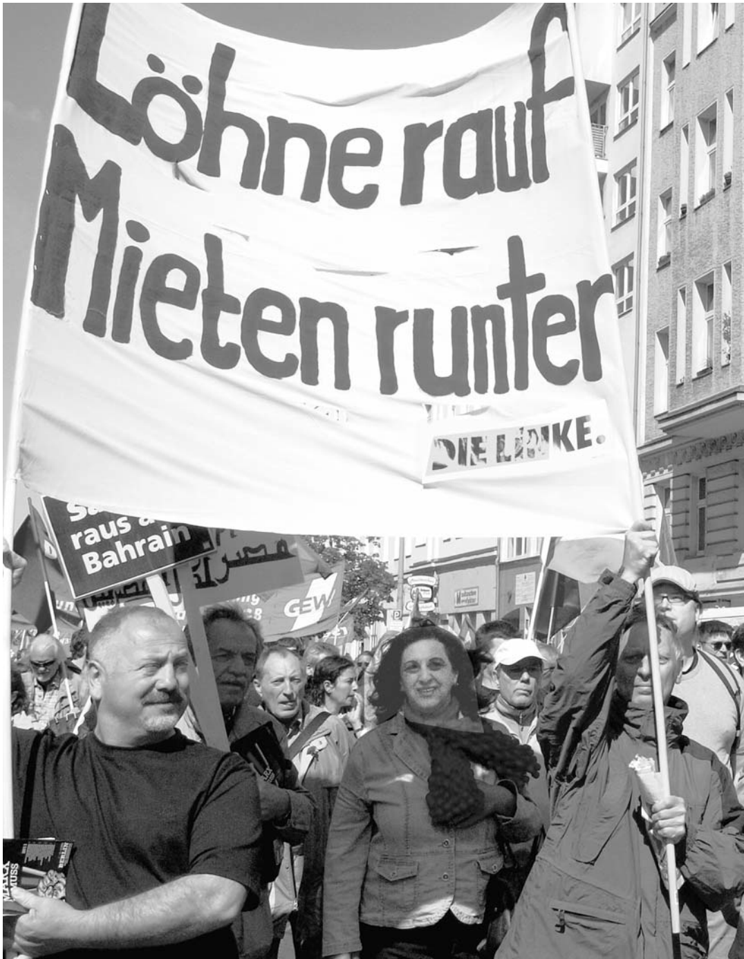
Der Regierende Bürgermeister Wowereit (SPD) hält steigende Mieten für ein Zeichen wachsenden Wohlstands. DIE LINKE, Neukölln fordert: Löhne auf, Mieten runter! Wohnungen dürfen nicht wie eine Ware gehandelt werden und der Profitmaximierung von Eigentümern und Fondsgesellschaften dienen.