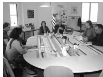
Mit den Quartiersmanagern von der Ganghoferstraße berieten LINKE-Politiker über die Wohnsituation im Kiez.

W as jeder gespürt hat ist damit bestätigt: Die Mieten steigen schneller als Löhne und Renten. In der Innenstadt führt das zu sozialer Verdrängung. Es betrifft insbesondere kleinere Wohnungen, bei denen die Nettokaltmieten im Berliner Durchschnitt mit 5,87 Euro je Quadratmeter deutlich über dem Mittelwert liegen. Tendenz weiter steigend. Im Reuterkiez sind zum Beispiel die Mieten für neu vermietete Wohnungen um rund 17 Prozent gestiegen.