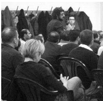
Debatte: Rassismus und soziale Ausgrenzung stehen Integration entgegen.