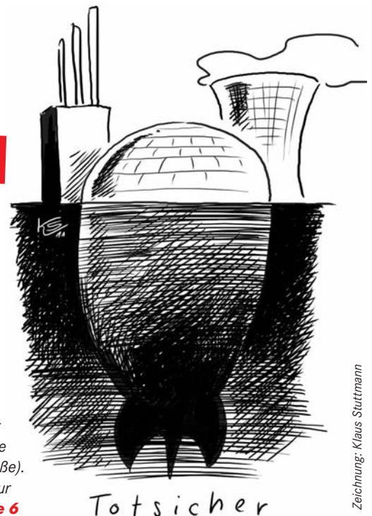
Zeichnung: Klaus Stuttmann