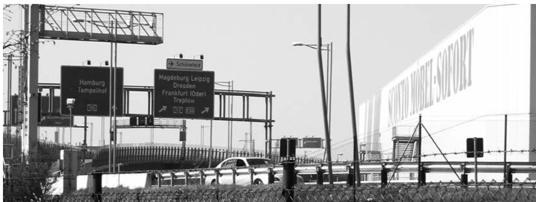
An der Grenzallee endet die Stadtautobahn A100, für die Fortsetzung nach Treptow wurde die Bremse gezogen.

Kritik gab es wegen der hohen Kosten und dem zweifelhaften Nutzen einer Umlenkung des Verkehrs auf eine zusätzliche Trasse. In Berlin ist nämlich der Autoverkehr in den letzten zehn Jahren zurückgegangen. Besonders stark war der Protest im benachbarten Treptow, das vom Bau als nächstes betroffen wäre. Dort wehrt man sich gegen den Abriss von Mietshäusern, die Aufgabe ganzer Kleingartenkolonien sowie gegen drohende Baumfällungen am Treptower Park.