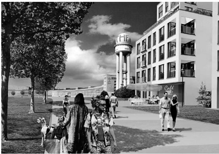
Zeichnung: Senatsverwaltung für Stadtentwicklung

Schöner Wohnen unterm Radarturm. So sieht die Senatsverwaltung für Stadtentwicklung die Zukunft des Tempelhofer Feldes.