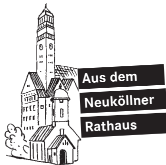
Vignette: Franz Zauleck

Zur Großen Anfrage der CDU zum Modellprojekt „Deutsch-Garantie“ brach eine ziemlich heftige Debatte los. Die CDU schlug vor, in Neukölln, ähnlich wie im Wedding, in den Grundschulen eine Extraklasse einzurichten für die Kinder, die zu Schulbeginn schon sehr gut