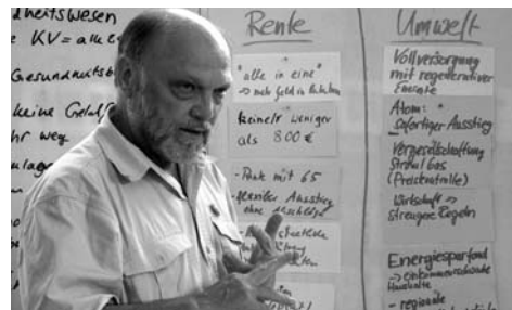
Mit einem Workshop bereiteten sich Mitglieder der Neuköllner LINKEN auf den Wahlkampf vor.