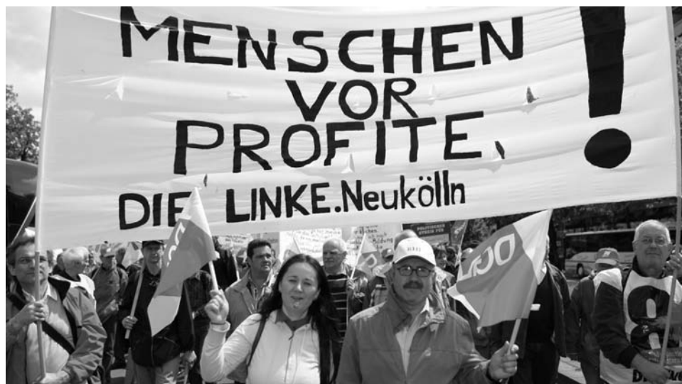
Beim europäischen Aktionstag der Gewerkschaften in Berlin am 16. Mai 2009.

4 Trauerspiel: Nur 10 neue Lehrkräfte für Neuköllner Schulen. Die GEW zum Schuljahresbeginn.