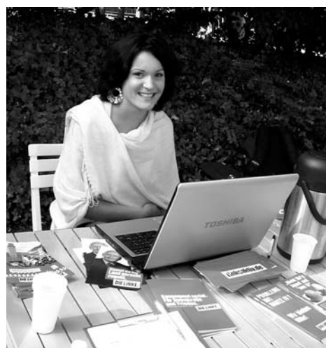
Briefwahlunterlagen können beantragt werden auf der Rückseite der Wahlbenachrichtigung oder Online, zum Beispiel am Info-Stand der LINKEN.

„Das ging ja schnell“, meinte eine Neuköllnerin, als sie am Info-Stand der LINKEN vor dem JobCenter online die Briefwahlunterlagen beantragt hatte.