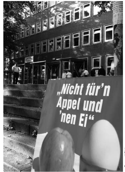
Vor dem JobCenter in der Sonnenallee.