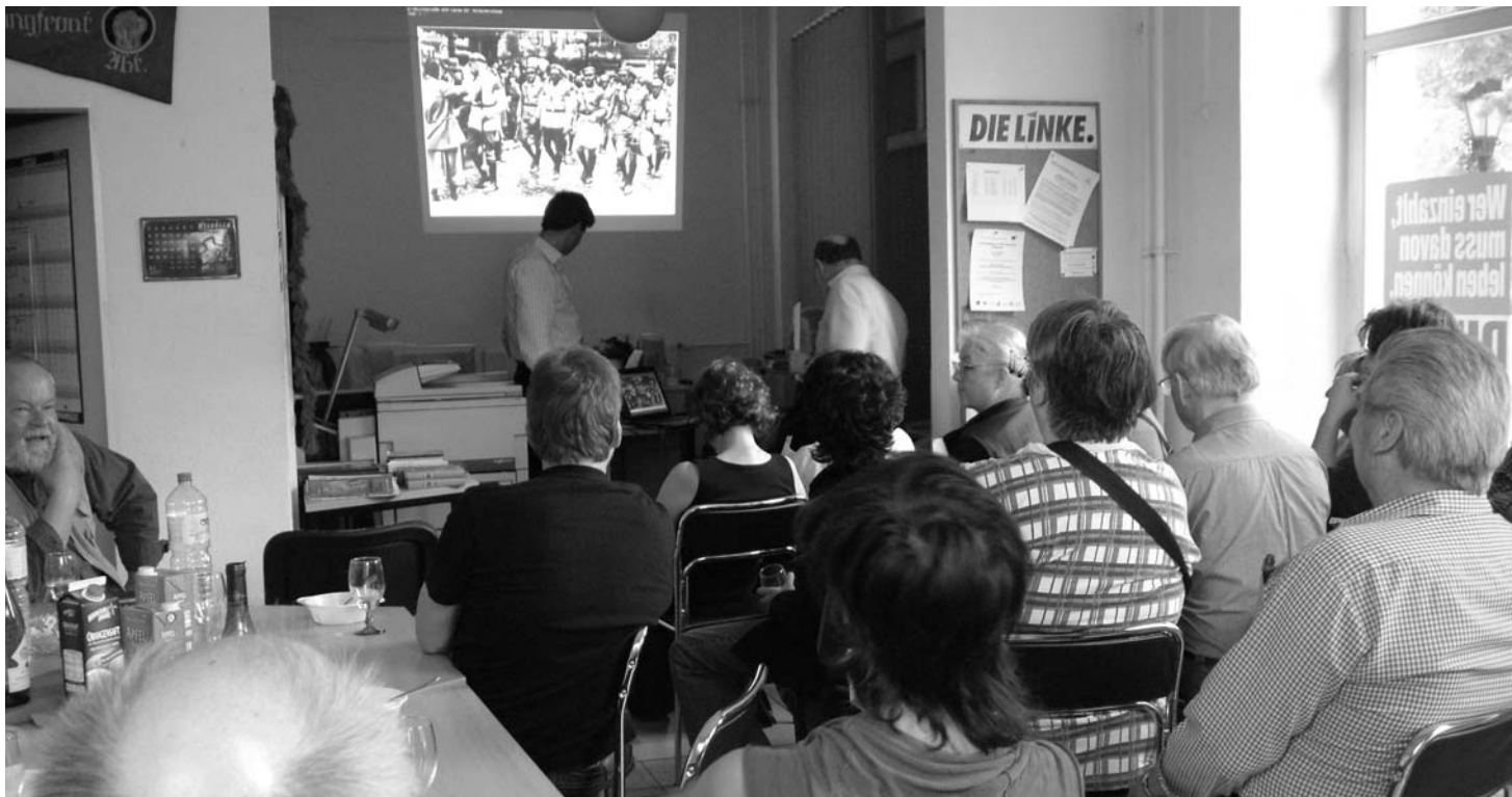
Die Ausstellungseröffnung „80 Jahre Blutmai in Neukölln - Lehren aus einem tragischen Ereignis“ am 30. April im Zentrum der Neuköllner LINKEN am Richardplatz gab viel Stoff für interessante Debatten - über die Weltwirtschaftskrise von 1929 und über die aktuelle Situation.