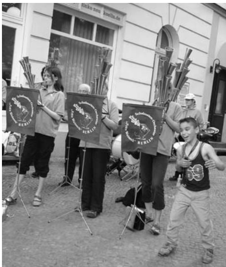
Das Schalmeienorchester „Fritz Weineck“ spielte zur Ausstellungseröffnung auf dem Richardplatz Lieder der Arbeiterbewegung.

Die Ausstellung am Richardplatz 16 ist bis Ende Mai geöffnet werktags von 17.00 bis 19.00 Uhr und nach Vereinbarung.