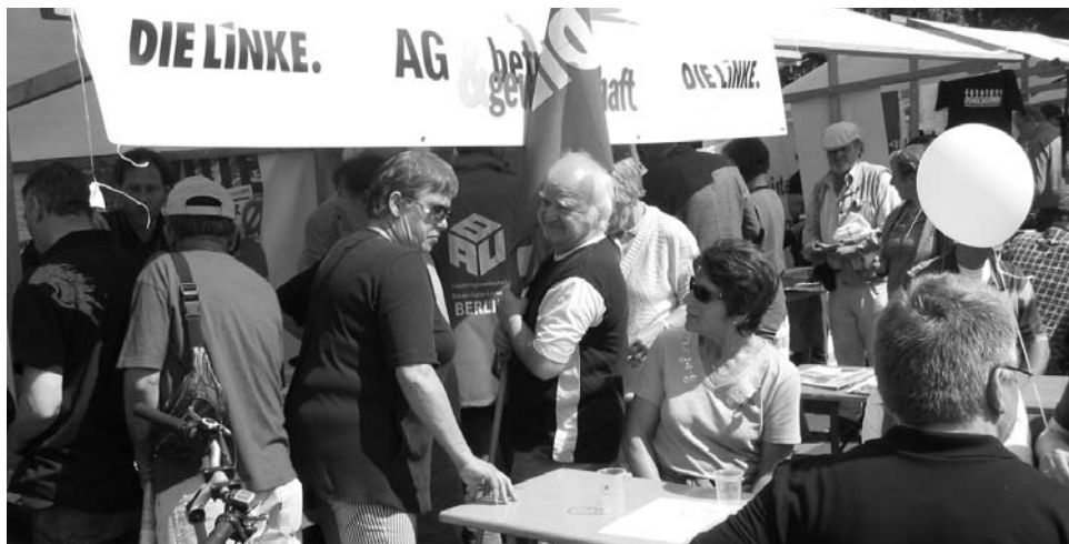
Dicht umlagert von den Kolleginnen und Kollegen war der Stand der Arbeitsgemeinschaft Betrieb & Gewerkschaft der LINKEN nach der Maidemonstration der Gewerkschaften am Brandenburger Tor. Von vielen nachgefragt: Das Programm der LINKEN „Schutzschirme für Menschen“.