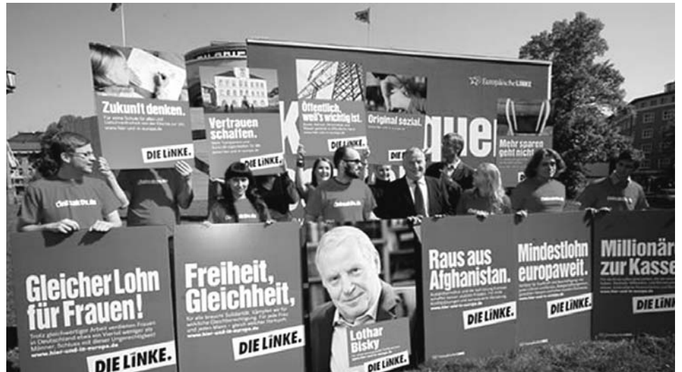
Präsentation der Plakate der LINKEN für den Europawahlkampf mit dem Spitzenkandidaten Lothar Bisky. Der Medienwissenschaftler ist Vorsitzender der LINKEN und der Europäischen Linkspartei.

Die Europäische Union greift in den Neuköllner Alltag ein