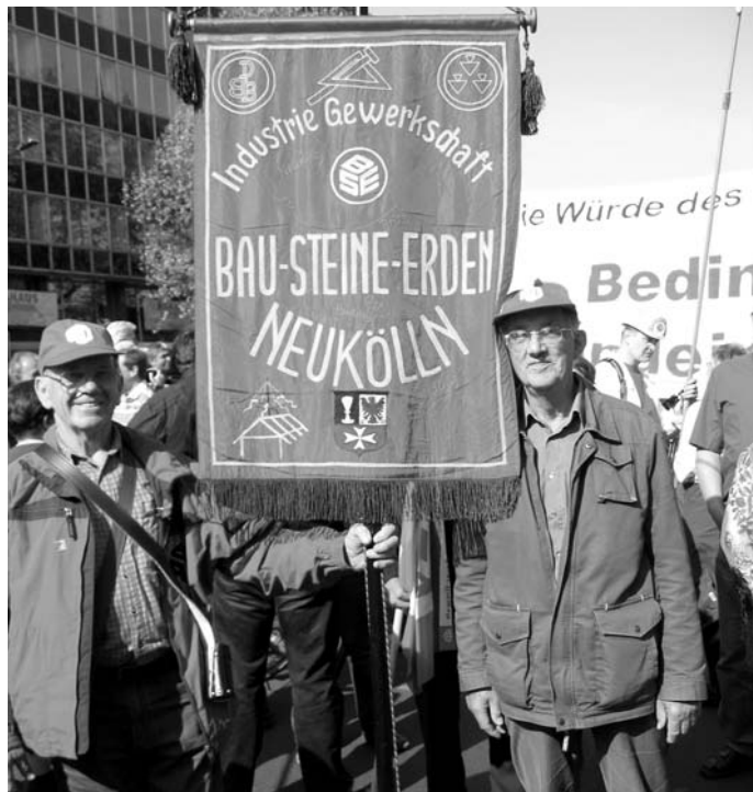
Die Kollegen der Industriegewerkschaft BAU Neukölln waren am 1. Mai mit ihrer Traditionsfahne dabei - sie kommen wieder: Am 16. Mai.