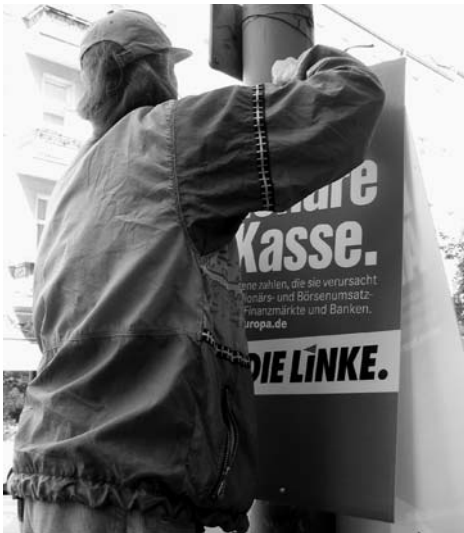
Millionäre zur Kasse. Klare Ansage der LINKEN im Europawahlkampf.