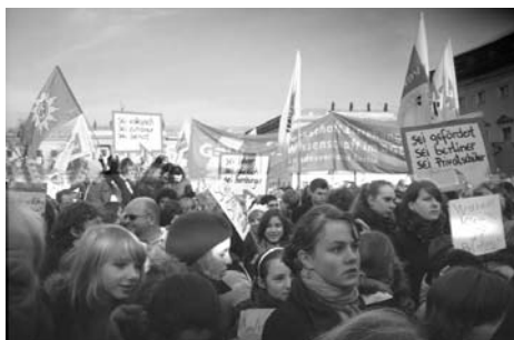
Mobilisierung der Beschäftigten auch am letzten Streiktag.