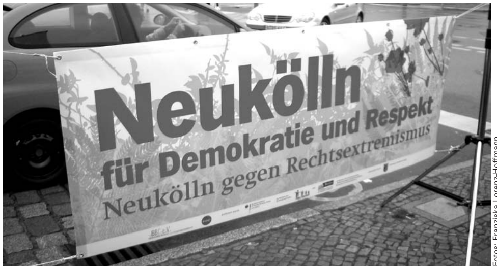
unter DIE LINKE, von Bürgerinitiativen, Kirchengemeinden demonstrierten in der Nähe der Rudower Spinne. Hier hatten sich in der letzten