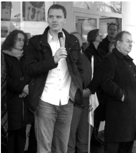
Aktionstag des Runden Tisches gegen Rechtsextremismus in Rudow am 15. November. Mitglieder demokratischer Parteien aus Neukölln, dar-