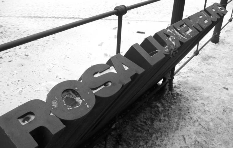
Mahnmal für Rosa Luxemburg an der Lichtensteinbrücke.