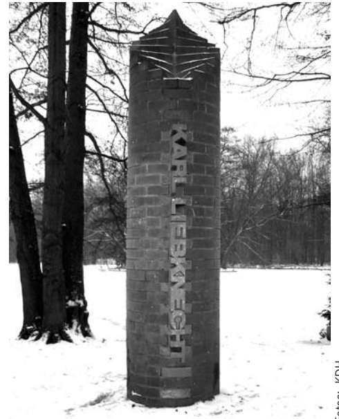
Stele für Karl Liebknecht im Tiergarten.