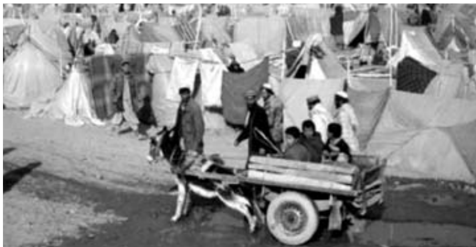
Mehr als fünf Millionen Flüchtlinge zählen zu den Opfern des Krieges am Hindukusch. Der Krieg der USA und ihrer Verbündeten „gegen den Terror“ fordert täglich neue Opfer unter der Zivilbevölkerung.

Über fünf Millionen Flüchtlinge ohne Zukunft stehen vor dem Hungertod, weil Milliarden Dollar im Namen des Antiterrorkampfes ausgegeben werden und dieser Kampf tötet Unschuldige und hindert die Rückkehr der Millionen Flüchtlinge und produziert noch mehr Flüchtlinge. Statt Bombenterror gegen die Zivilbevölkerung sollte es ein Austrocknen der Zulaufquellen für Waffen und Geld der Taliban und anderen Parteien geben. Und die Entmachtung aller Mafiabanden, Kriegerverbrecher und Islamistenführer. Politisch und finanzielle Unterstützung aller demokratischen und Zivilkräfte und Persönlichkeiten und sorgen für ihre Sicherheit. Ehrliche Unterstützung aller Frauenorganisationen und Beteiligung der Frauen an der Regierung und im Entscheidungsgremium. Kein Einsatz der internationalen Soldaten in einem unsinnigen Krieg gegen die Zivilbevölkerung in Afghanistan. Kein deutscher Soldat zum Schutz der Drogenmafia und Warlords und Islamisten. Keine Macht den Taliban und andern Islamisten und Kriegerverbrechern.