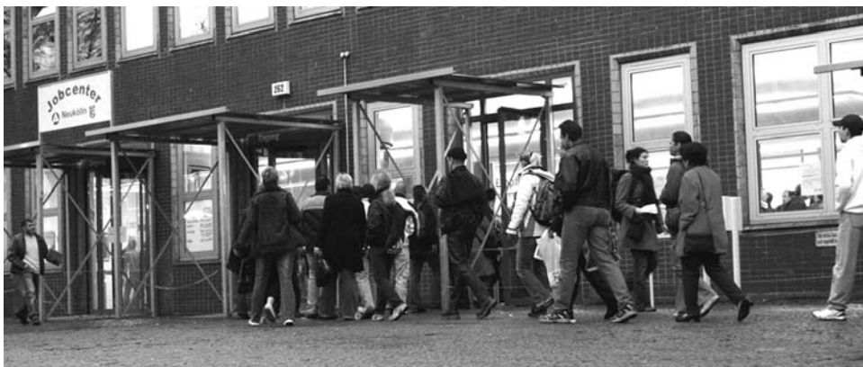
Zur Unterstützung für eine Bundesratsinitiative zur Erhöhung des Eckregelsatzes wollen die Mitglie- der der BO Rixdorf aktiv werden, zum Beispiel vor dem Job-Center Neukölln in der Sonnenallee.

Immer mehr Menschen haben immer weni- ger Geld, mit dem sie für das Allernötigsten immer mehr bezahlen müssen. Die jährliche Teuerungsrate lag im Mai 2008 wieder über drei Prozent. Vor allem die Preise von Waren, die zur unverzichtbaren Grundversorgung gehören, sind in den letzten 12 Monaten geradezu explo- diert. So stiegen die Preise für Molkereiproduk- te und Eier seit Mai 2007 um 17,9 Prozent, die für Speisefette und -öle um 15,4 Prozent, für Brot und Getreideerzeugnisse um 8,9 Prozent, für Obst um 8,4 Prozent – um nur einige Bei- spiele zu nennen. Betroffen von diesen Preiser- höhungen sind vor allem Geringverdiener, da diese einen überdurchschnittlichen Anteil ihres Einkommens für Güter des täglichen Bedarfs ausgeben müssen. Auch von der Erhöhung der Mehrwertsteuer um gleich drei Prozentpunkte sind Menschen mit geringem Einkommen über- proportional betroffen.