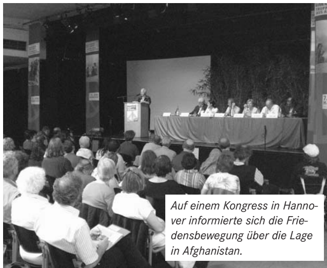
Auf einem Kongress in Hannover informierte sich die Friedensbewegung über die Lage in Afghanistan.

74 Prozent der deutschen Bevölkerung lehnen laut SPIEGEL eine Aufstockung der Bundeswehrtruppen in Afghanistan ab.