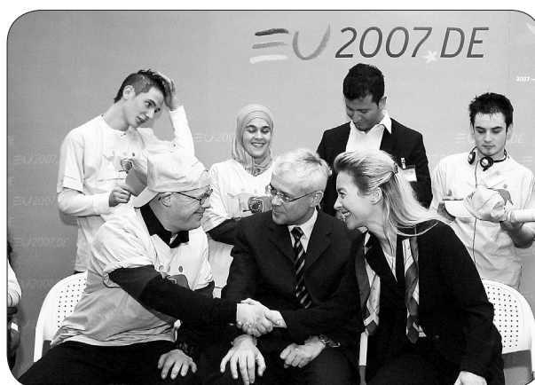
Chancengleichheit nicht nur zu Festtagen

2007 – Europäisches Jahr der Chancengleichheit