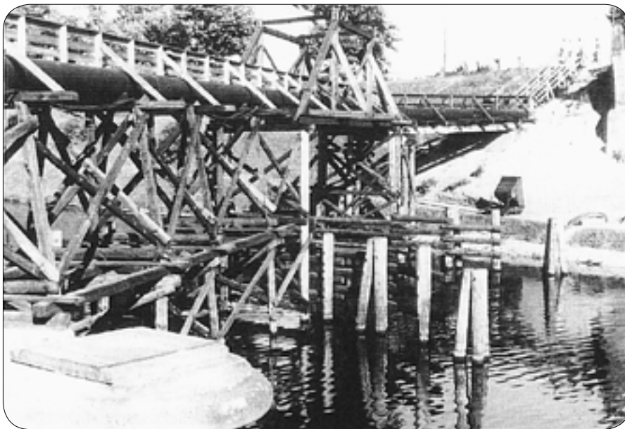
Notsteg an der zerstörten Wilhelm-Bergmann-Brücke über den Teltowkanal in Britz

Über die Laubenkolonie in der Hermannstraße, direkt an der Grenze zum Ortsteil Britz, piffen die Kampfgeschosse. Sowjetische Panzer hatten sich bis an den Teltowkanal heran gekämpft und hielten nun den Widerstand versprengter faschistischer Truppen nieder, die einige Häuser hinter der Kolonie besetzt hielten. Noch am Vormittag waren verwundete, demoralisierte, verzweifelte und müde Landsknechte Hitlers über die Britzer Brücke gehinkt und geschlichen, um sich in den Straßenschluchten des Arbeiterviertels zu verlieren. Plötzlich tauchten einige Durchhalteoffiziere auf und zwangen die kriegsmüden Soldaten, sich in Schützenlöchern am Kanalufer zu verschanzen.