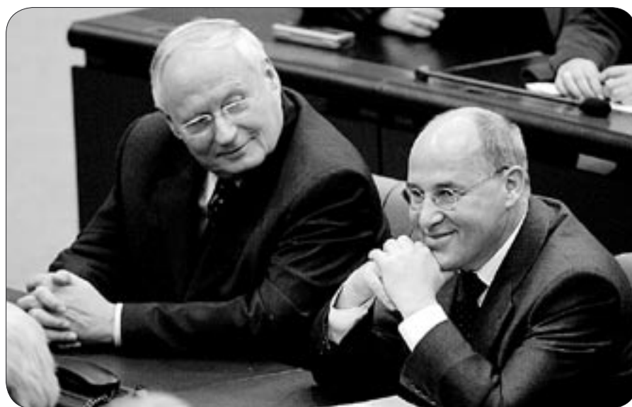
Mit Oskar Lafontaine und Gregor Gysi besitzt die »Die Linke.« im Bundestag eine schlagkräftige Doppelspitze

»Wir wollen in der Bundesrepublik Deutschland eine neue politische Partei entwickeln. Diese Parteibildung ist kein Selbstzweck«, erklärte Lothar Bisky (MdB) bei einer Pressekonferenz. Im Mittelpunkt stehe der Anspruch der Linkspartei.PDS, »dieses Land verändern zu wollen hin zu mehr sozialer Gerechtigkeit, Demokratie, Freiheit, Selbstbestimmung und ziviler Konfliktlösungen«.