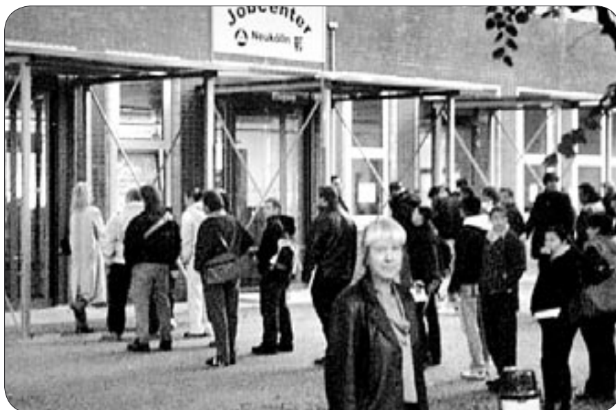
Aktion der Neuköllner Linkspartei.PDS vor dem Jobcenter