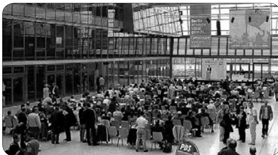
»Berlin: Attraktiv, sozial, gerecht – Gemeinsam sind wir Stadt« das Motto des Landesparteitages

Die Berliner PDS will mit einem Konzept der »Sozialen Stadt« der ihrer Ansicht nach neoliberalen Bundespolitik des Sozialabbaus entgegenwirken. Mit Blick auf die Wahl zum Abgeordnetenhaus 2006 verabschiedete der kleinere Berliner Regierungspartner am Samstag auf einem Landesparteitag »Strategien für eine soziale und solidarische Stadtgesellschaft«.