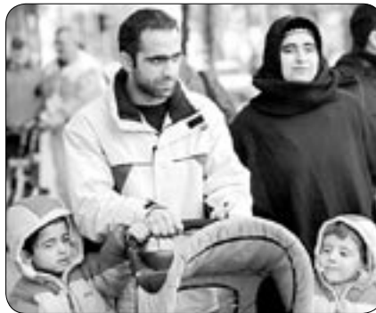
Leben im Bezirk

Eines hat jedoch die Ethnisierung und Kulturalisierung von sozialen Konflikte bewirkt. Andere, bedeutendere Konfliktursachen, vor allem solche, die mit staatlich sanktionierten Diskriminierungen zu tun haben, werden weitgehend ausgeblendet und verschleiert. Dagegen wird das Bild des »integrationsunwilligen« bzw. »-unfähigen« Migranten gezeichnet. Jörg Schönbohm hat diese in erster Linie in »Zuwandergruppen aus dem arabisch-moslemischen Kulturkreis (u.a. der Türkei)« ausgemacht. Als einen der Hauptgründe für die Schwierigkeiten bei der Integration dieser Gruppen benennt er die Religion. Erstaunlich ist, dass doch gerade bei türkischen Migranten ein nicht geringer Teil keinerlei bzw. nur eine marginale Verbindung zum Islam hat. Dass vor allem die