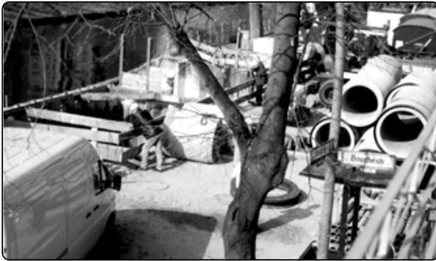
Ein Blick auf die Baustelle, die bei den Anwohnern für viel Unruhe sorgte.

Von Anfang Januar bis fast Mitte November gab es am Neuköllner Schiffahrtskanal eine Baustelle zur Unterquerung der Wasserstraße. Zwar hatte die Firma Heizwerk Neukölln AG den Anwohnern versprochen, die Arbeiten seien im August abgeschlossen, dennoch verzögerten sie sich bis Anfang November. Im Klartext: Weiter monatelange Straßensperrungen. Und die Auswirkungen auf die Mieter: Monatelange Ausschachtarbeiten und Motorengebrumme. Diese wurden sogar