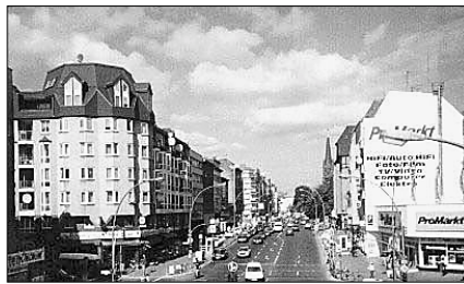
Wenig ist geblieben von der Einkaufskultur in der Karl-Marx-Straße, die früher eine der größten Kaufmeilen Westberlins war.